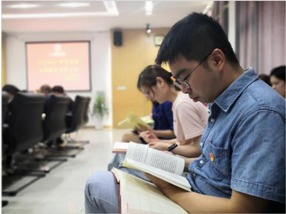
图 8 教师党员翻阅学习纲要